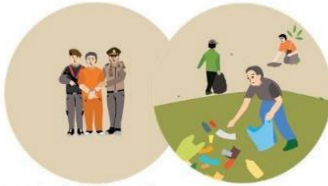
กฎหมายอาญาและกฎหมายปกครองที่ลงโทษและป้องกัน

แม้ว่ากฎหมายและวิธีการจะแตกต่างกันไปแต่ละเขตอำนาจศาล แต่ก็มีความต้องการให้มีการตอบสนองเพิ่มเติมเกี่ยวกับข้อกฎหมายแบบกว้างๆ สองประการ คือ ให้มีการตอบสนองเรื่องการลงโทษและป้องกันและให้มีบทบัญญัติให้แก้ไขและรักษาธรรมชาติ (รูปที่ 1)