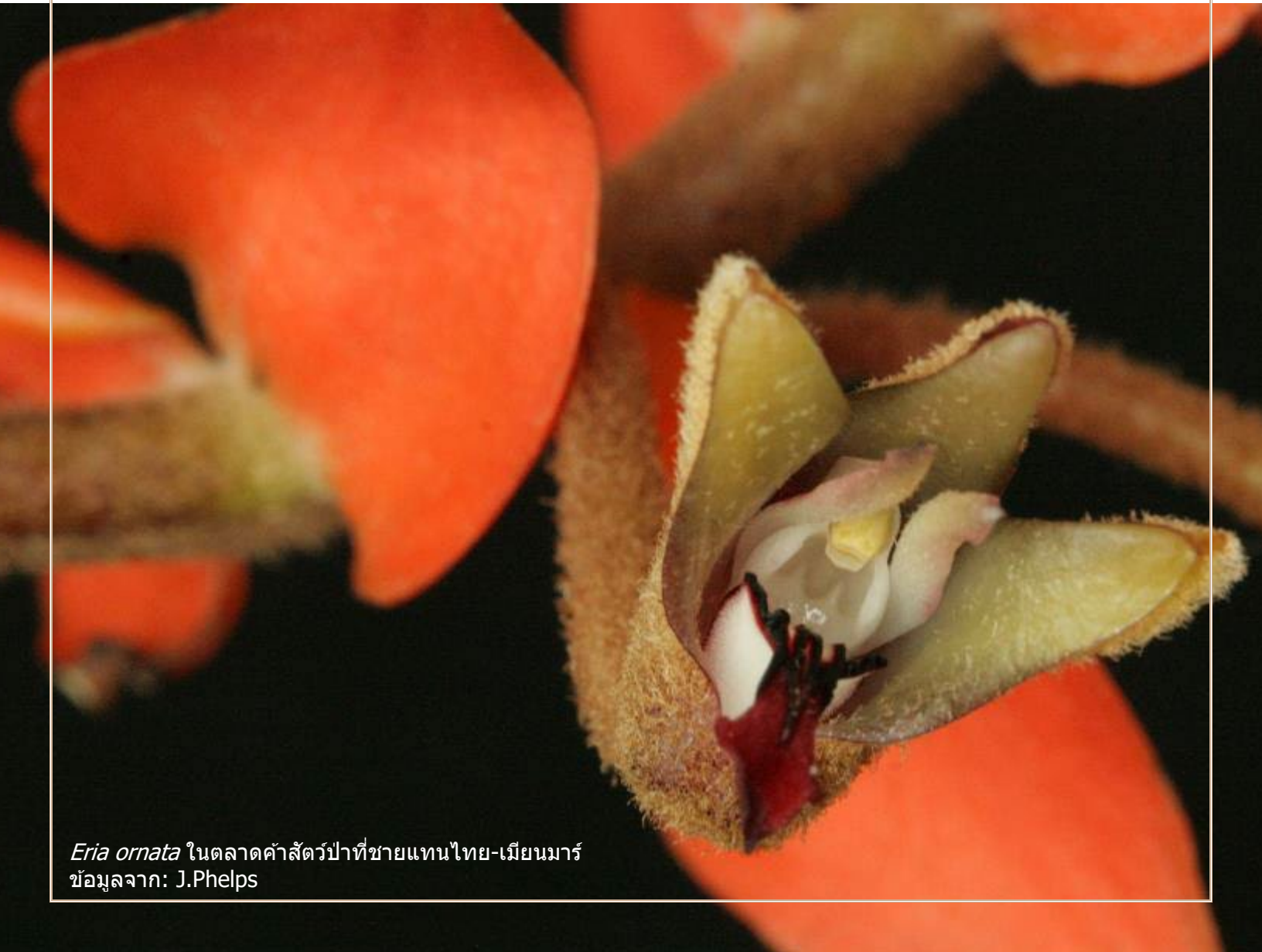
Eria ornata ในตลาดค้าสัตว์ป่าที่ชายแดนไทย-เมียนมาร์ ข้อมูลจาก: J.Phelps