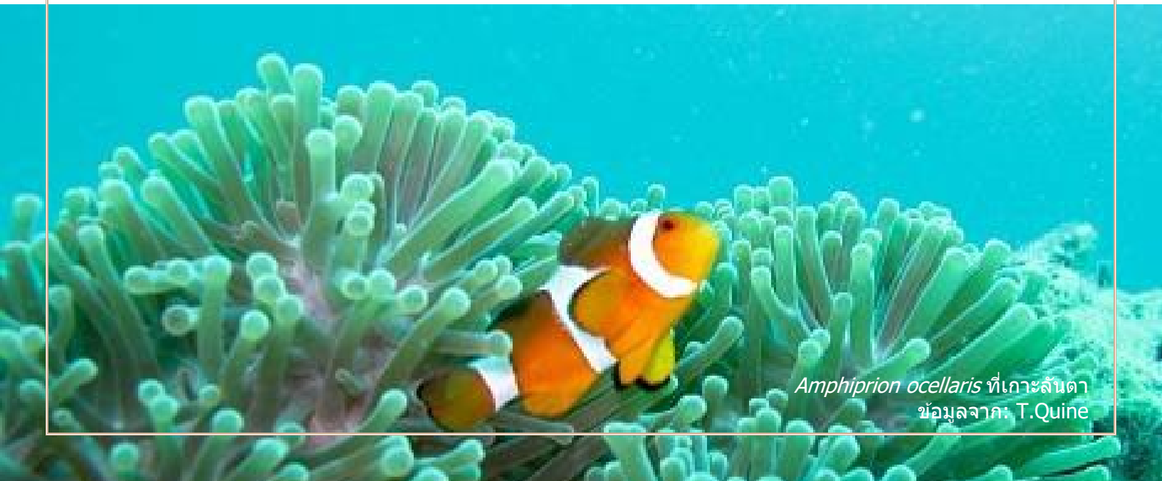
Amphiprion ocellaris ที่เกาะลันตา

บทบัญญัติเกี่ยวกับความรับผิดชอบมีอยู่ในประเทศต่างๆ ทั่วโลก และบทบัญญัติเหล่านี้พบได้ในประเภทของกฎหมายที่แตกต่างกัน ซึ่งหมายรวมถึงประมวลกฎหมายแพ่ง กฎหมายเฉพาะด้านสิ่งแวดล้อม วิธีพิจารณาคดีทางปกครอง และแม้กระทั่งกฎหมายอาญา 4 ที่สำคัญกฎหมายภายในประเทศที่บังคับคดีเกี่ยวกับความรับผิดชอบเหล่านั้นจะมีความต่างกันเป็นอย่างมาก