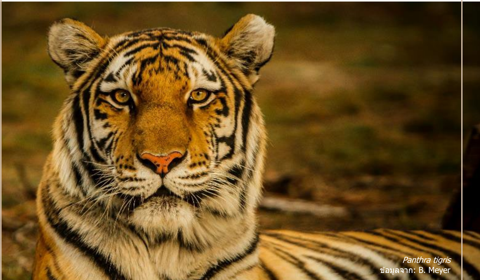
Panthera tigris

ในแง่หนึ่งก็มีความจำเป็นที่ต้องดำเนินงานในแนวทางที่เรียบง่าย ปฏิบัติได้จริง ซึ่งช่วยลดภาระทางเทคนิคและช่วยให้เจ้าหน้าที่สามารถดำเนินการได้อย่างทันท่วงที อย่างไรก็ตาม การค้นหาแนวทางที่ง่ายขึ้นจะหมายความว่ารายการราคาและสูตรการคำนวณทางเทคนิคจะไม่ถูกนำมาใช้ เนื่องจากจะเป็นการรวมค่าปรับในรูปของตัวเงินและสูตรคำนวณทางเทคนิคสำหรับการวัดคุณค่าการบริการทางระบบนิเวศเข้ากับการเยียวยาอย่างผิดพลาด การจ่ายเงินเป็นจำนวนคงที่ไม่ได้ครอบคลุมถึงการดำเนินการทั้งหมดที่เจ้าหน้าที่อาจต้องดำเนินการเพื่อเยียวยาความเสียหาย และไม่ได้แสดงถึงคุณค่าที่สำคัญในความหลากหลายทางชีวภาพ แทนที่จะเป็นเช่นนั้น การเยียวยากลับอ้างอิงตามการกระทำที่จำเป็นเพื่อตอบสนองต่อความเสียหายแทน อาจเป็นประโยชน์ที่จะมีรายการการเยียวยาที่โดยปกติแล้วเจ้าหน้าที่จะคำนวณในกรณีประเภทนี้ จากนั้น "มูลค่างรวม" ของความเสียหายต่อสิ่งมีชีวิตจะถูกคำนวณเป็นรายการซึ่งไม่ใช่จำนวนคงที่ แต่เป็นต้นทุนค่าใช้จ่ายขั้นสุดท้ายซึ่งเป็นผลมาจากการดำเนินการเยียวยาที่ดำเนินการโดยเจ้าหน้าที่ ตัวอย่างเช่น เมื่อไม่นานมานี้ มีการจัดทำแนวทางสำหรับการดำเนินคดีเกี่ยวกับความเสียหายต่อความหลากหลายทางชีวภาพในอินโดนีเซีย 3 (กรอบที่ 6)