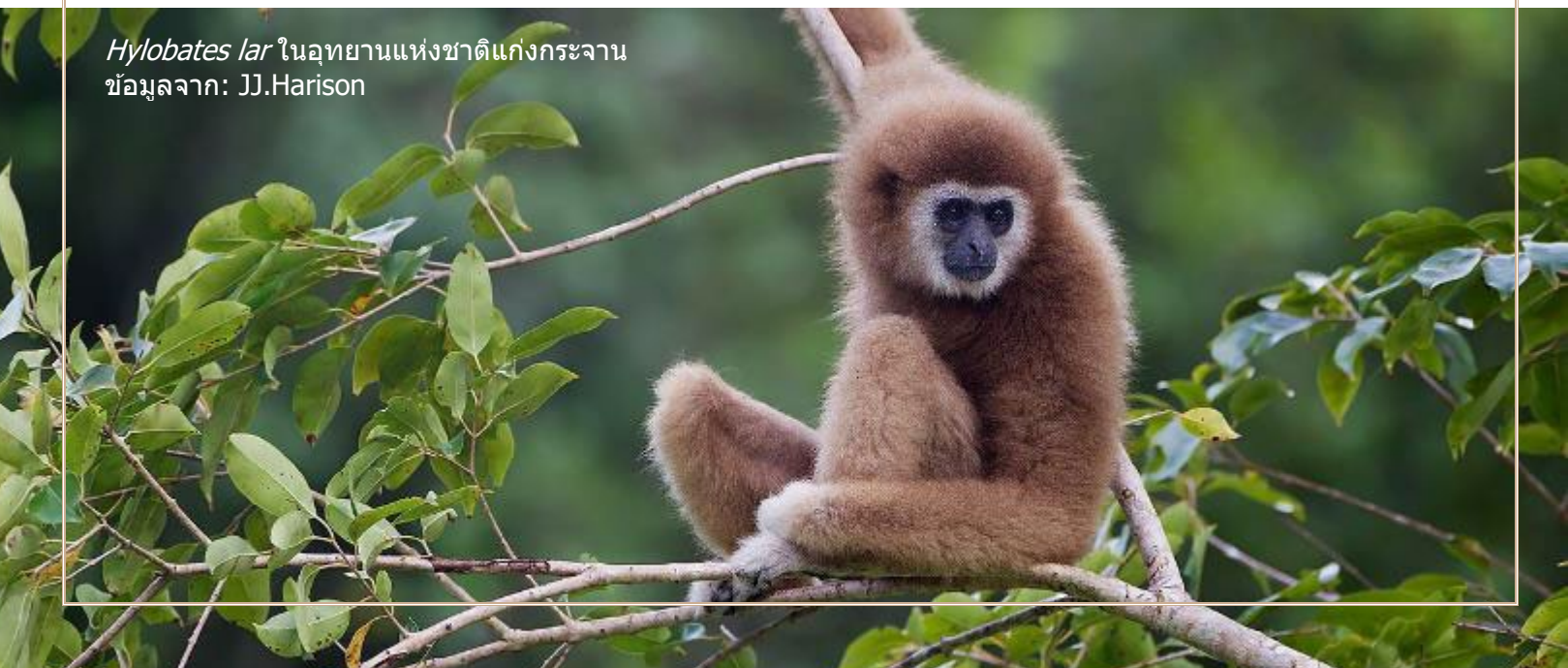
Hylobates lar ในอุทยานแห่งชาติแก่งกระจาน

อันตรายเหล่านี้อาจกลายเป็นประเด็นของการดำเนินคดีให้มีความรับผิดชอบได้ในอนาคต เพื่อให้คู่ความฝ่ายที่รับผิดชอบต้องรับผิดชอบในการเยียวยาสิ่งเหล่านี้